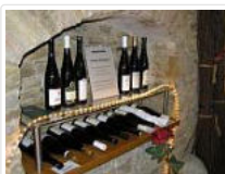
Fachlich geführte Exklusiv-Verkostung. Mit Heike Schäfer

Der Begriff Erstes Gewächs wird ausschließlich im Rheingau verwendet für Weine aus den Ersten Lagen. Die regionale Exklusivität des Begriffs hat historische Gründe.